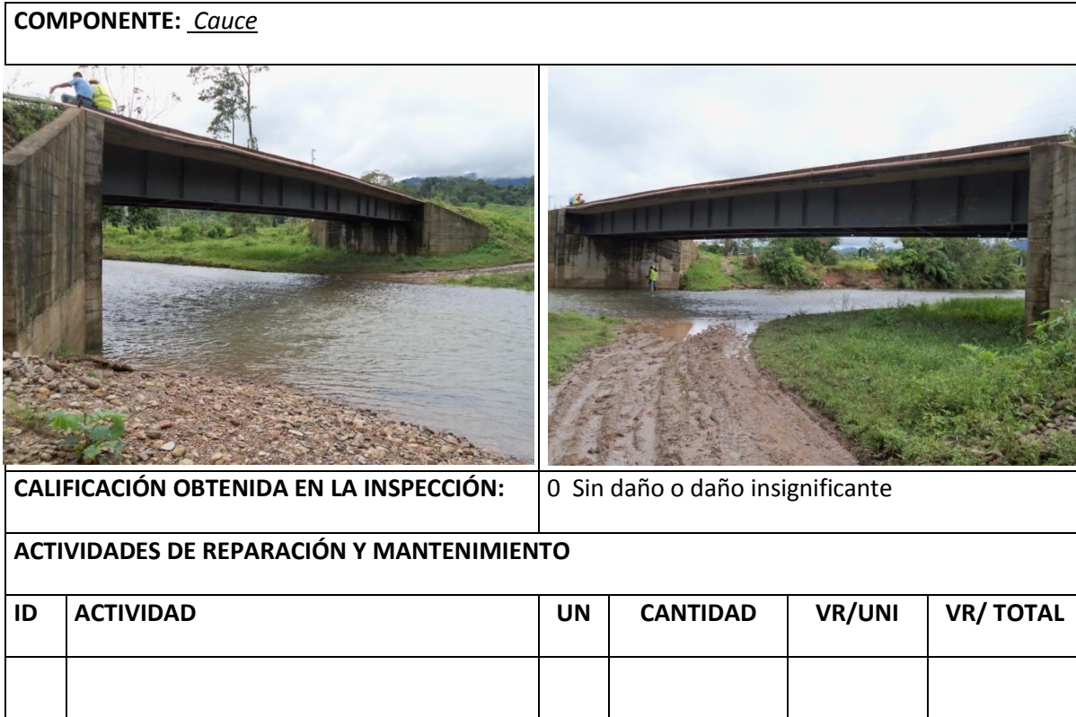
Tabla 12 Resumen Inspección Principal Cauce