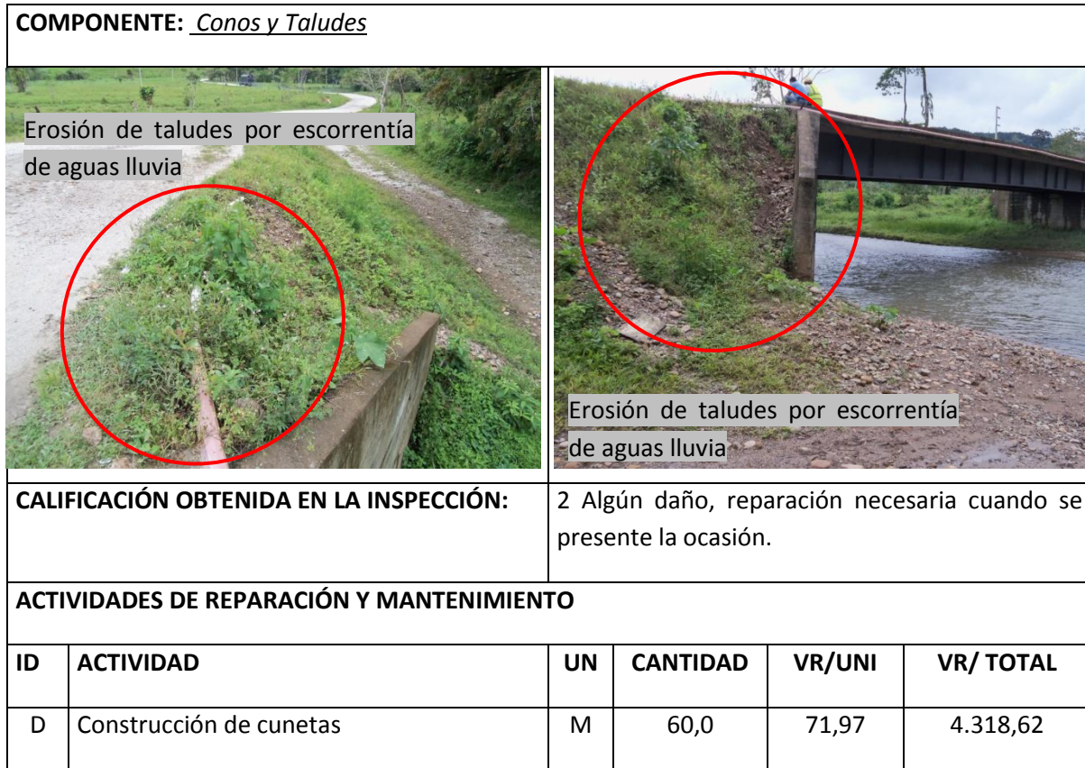
Tabla 5 Resumen Inspección Principal Conos y Taludes