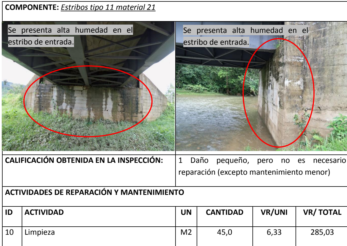
Tabla 7 Resumen Inspección Estribos