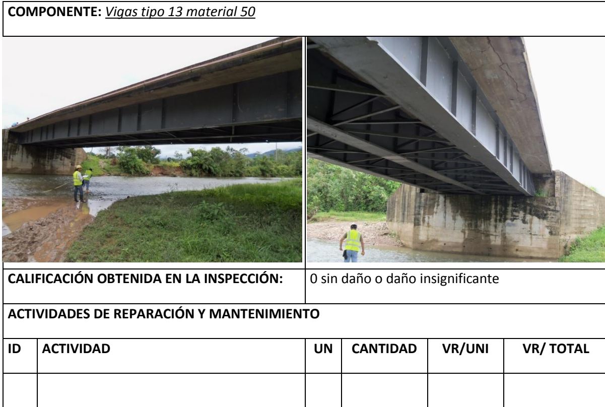
Tabla 10 Resumen Inspección Vigas / Losas / Diafragmas