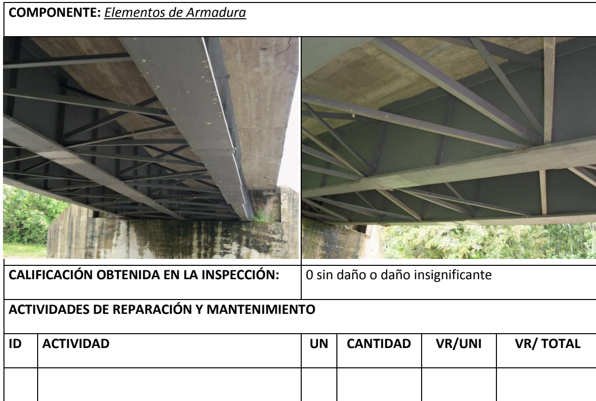
Tabla 11 Resumen Inspección Elementos de Armadura