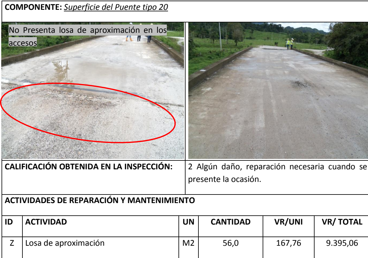
Tabla 2 Resumen Inspección Superficie del Puente