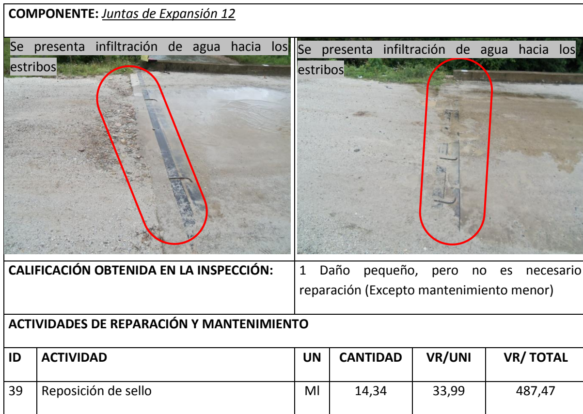
Tabla 3 Resumen Inspección Principal Juntas de Expansión