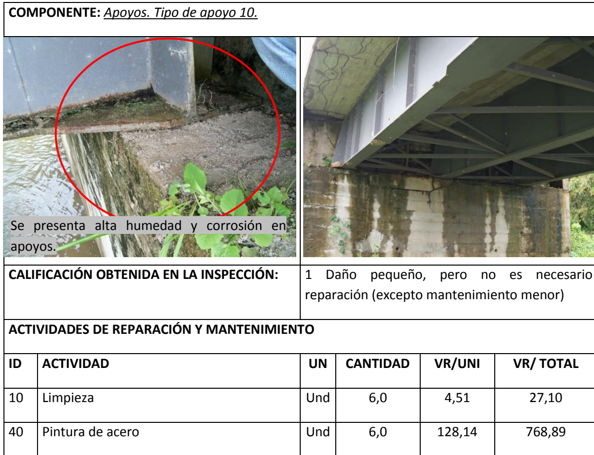
Tabla 8 Resumen Inspección Principal Apoyos