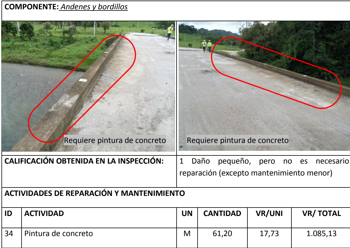
Tabla 4 Resumen Inspección Principal Andenes y Bordillos