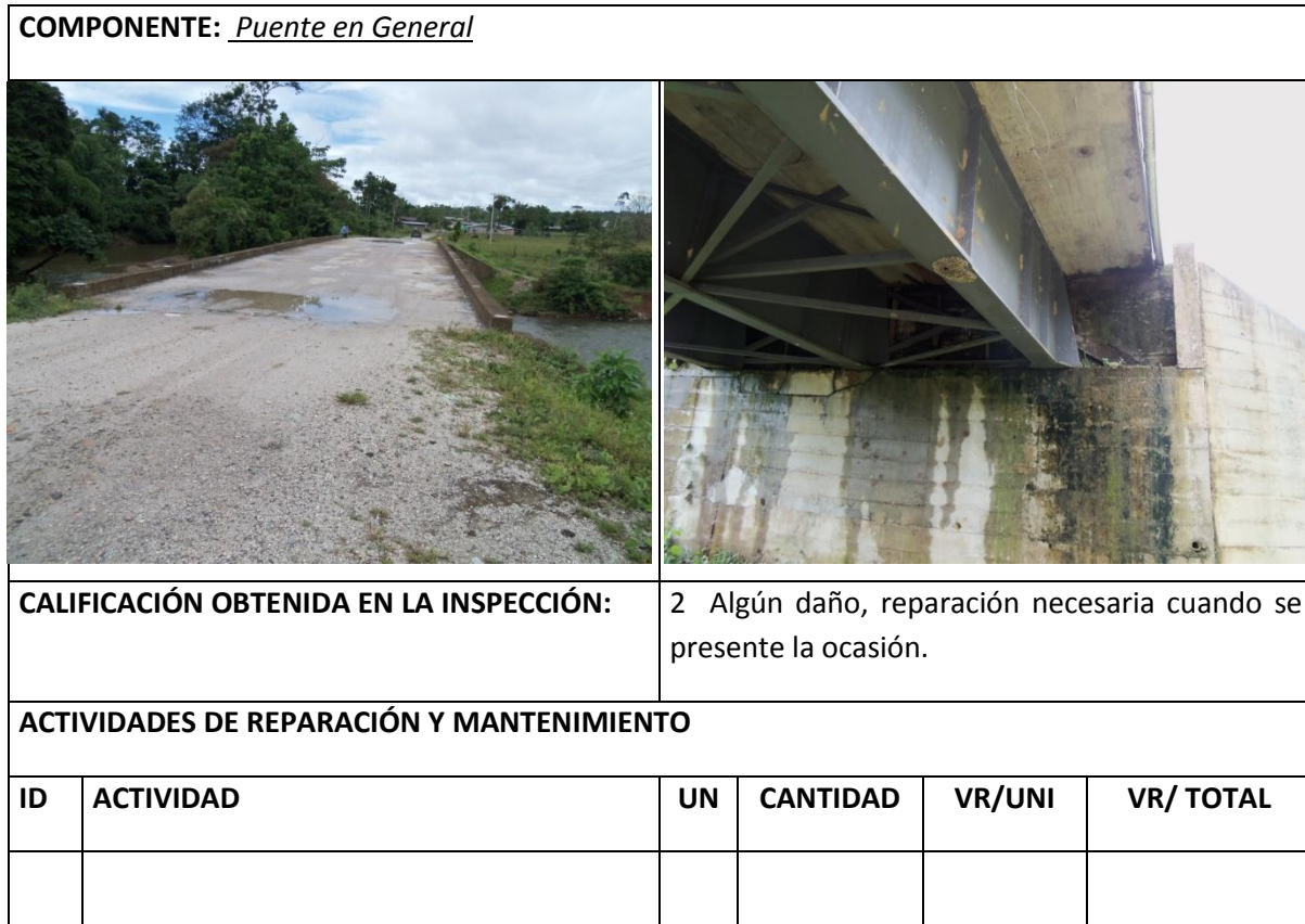
Tabla 13 Resumen Inspección Principal Puente en General