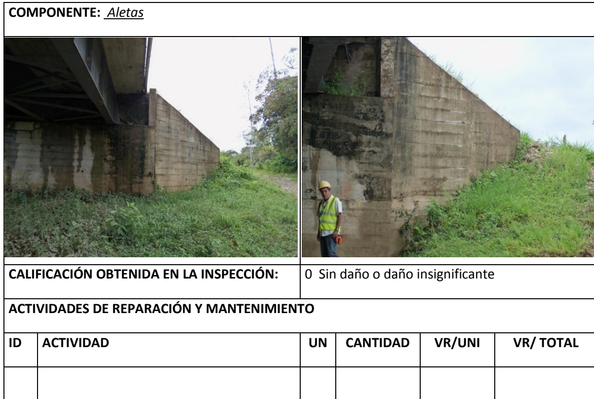
Tabla 6 Resumen Inspección Principal Aletas