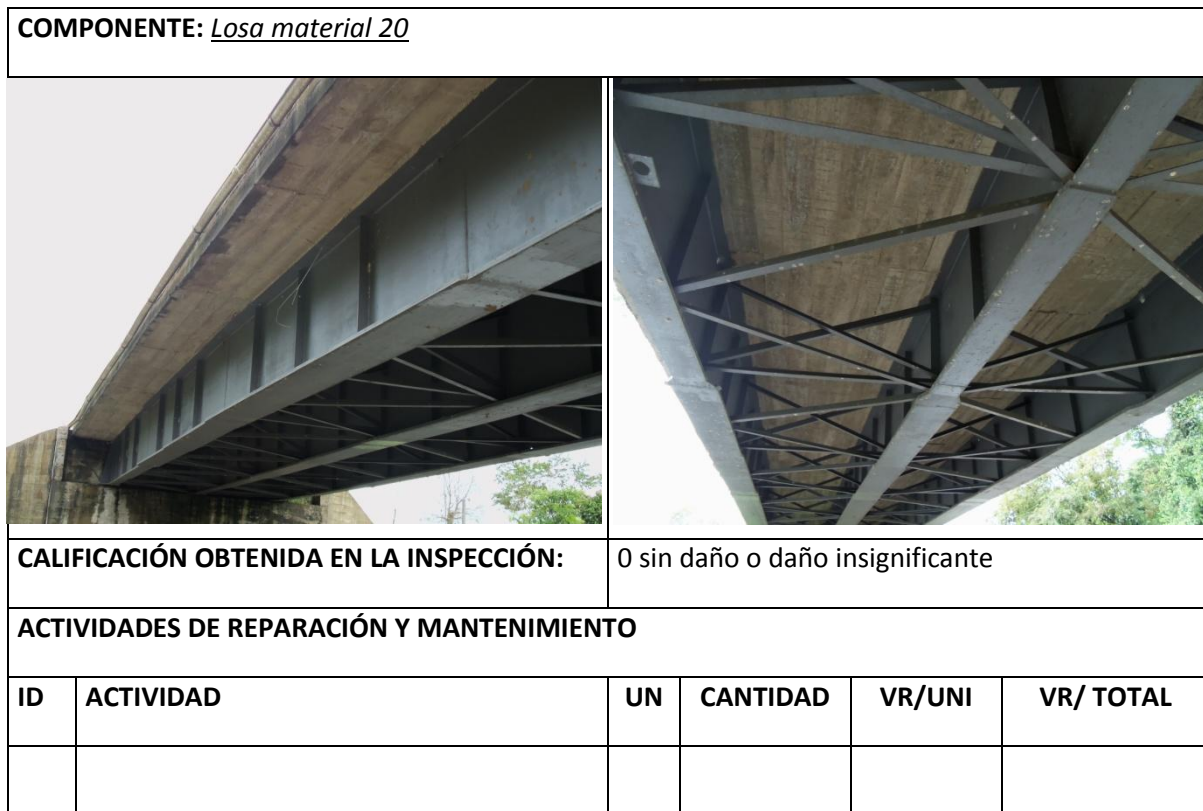
Tabla 9 Resumen Inspección principal Losa